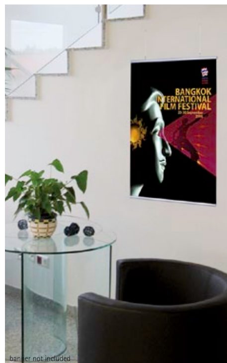
banner not included